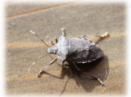
クサギカメムシ (カメムシ科)