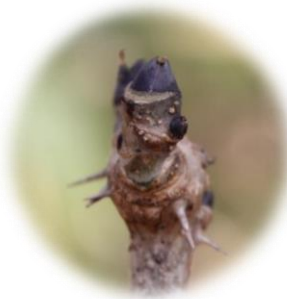
ハリギリの冬芽 (ウコギ科)