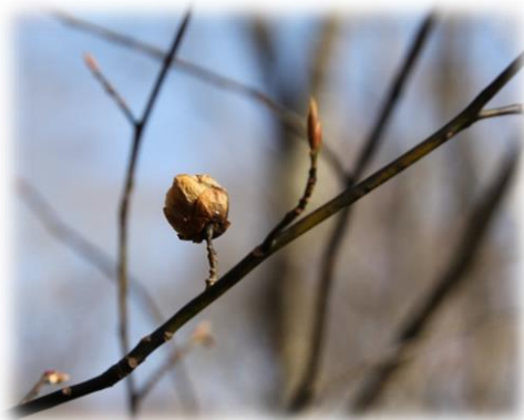
オオバクロモジの虫こぶ