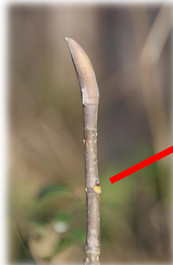
ホオノキの冬芽 (モクレン科)