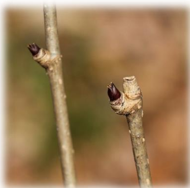
コシアブラの冬芽 (ウコギ科)