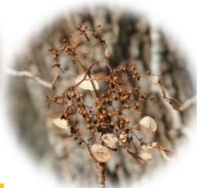
イワガラミの ドライフラワー