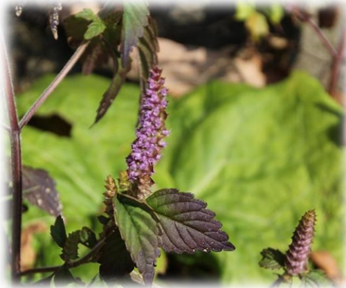
ナギナタコウジュ (シソ科)